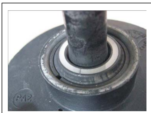
产品故障部位（叶轮密封环）