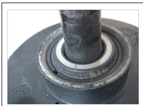
产品故障部位（叶轮密封环）